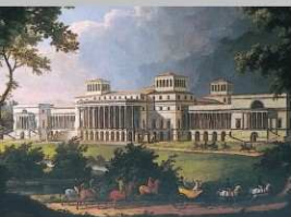
Charles Moreau: A kastély tervezett kerti homlokzata (1812)