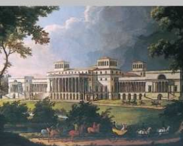
Plánovaná podoba fasády záhradného traktu (rok 1812)