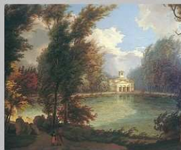
Strojňová s vodnou nádržou (rok 1809)

Súčasná podoba partera oranžérie vznikla začiatkom 20. storočia. Vďaka tisom, modrým smrekom a kaukazským jedliam zastrihnutých do tvaru kužela a radom červeno kvitnúcich gaštanov tvorí rozkošný kontrast k anglickému štýlu parku. Jedným z mála barokových prvkov v záhrade je gaštanová aleja . Kedysi ju tvorili dva rady stromov zastrihnutých do pravouhlého tvaru. Dodnes sa zachovali len zvyšky bývalej koncepcie.