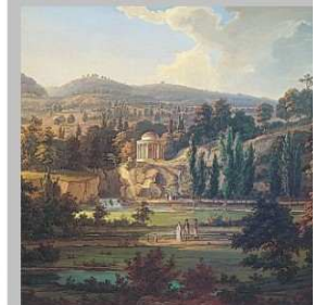
Leopoldin chrám (Dies, rok 1807)

Pri zostupe môžeme zostúpiť k Srdiečkovej vodnej nádrži, ktorá sa nachádza nad oranžériou. V súčasnosti je vo veľmi zanedbanom stave. Aj túto časť parku v blízkej budúcnosti čaká sanácia. V okolí vodnej nádrže sa nachádzajú pekné exempláre gledície a nahovetveca dvojdomého.