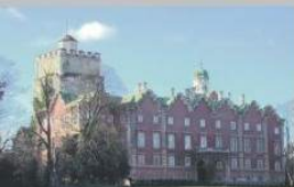
A Bruck- i kastély

1689-ben Bruck an der Leithát megszerezte I. Ferdinánd Bonaventura gróf . 1707- el kezdve a gróf fia Alajos Tamás Raimund gróf átépítette a kastélyt Johann Lukas von Hildebrand tervei szerint.