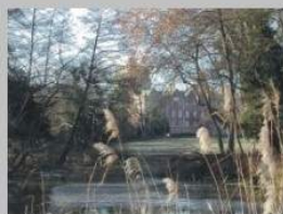
A kastélyra néző látótengely