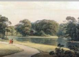
Tájképi kert (Gauermann, 1810)