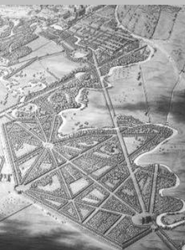
Barokk kert (1730)

A park séta közben változatos érzelmi hatások sorozatát váltja ki a látogatóban: vidám, világos, virágdús rétek váltakoznak melankolikus, kisterületű, árnyékos rétekkel és erdei ösvényekkel.